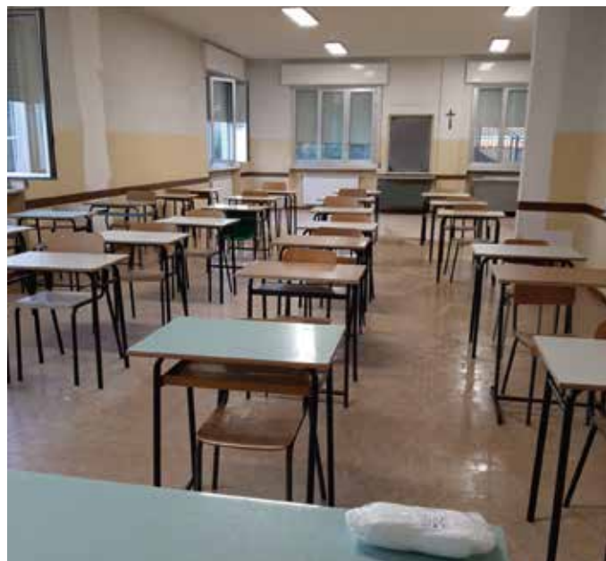
Adeguamento aula Scuola Secondaria

per consentire l'ampliamento della superficie utile ad ospitare con l'adeguato distanziamento, classi numerose.