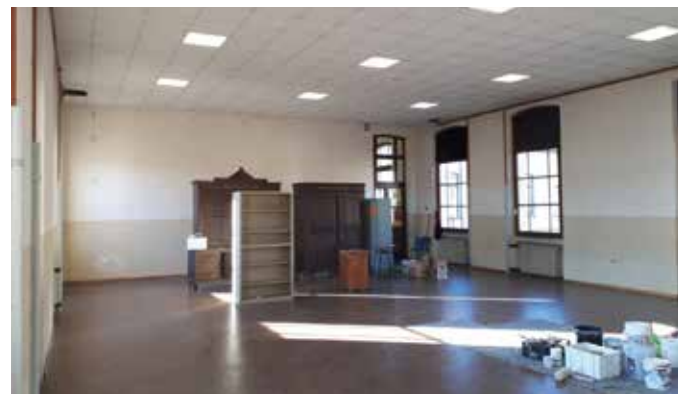
Salone multimediale prima

Sono state acquistate, attrezzature per l'esterno e per le aule, utili a modulare e suddividere gli spazi durante le varie attività.