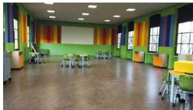
Salone multimediale dopo